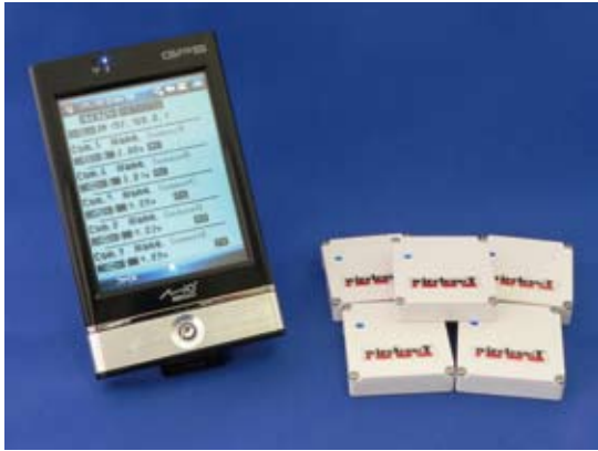
※PDAとセンサは付属しません。