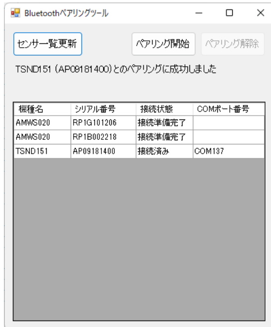
図 4 ペアリング設定終了後の画面

COM ポート番号が表示されない場合は「センサー一覧更新」のボタンを押下して COM ポート番号が表示されないか確認してください。センサー一覧の更新を行っても COM ポート番号が表示されない場合は COM ポート接続の設定に失敗している場合がありますので、3.4 節に従って一度ペアリングの解除を行ってから再度ペアリング設定を行って下さい。