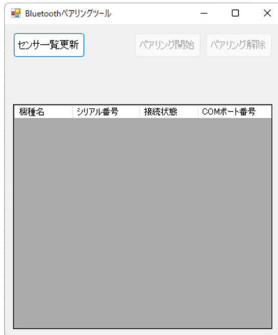
図 1 Bluetooth ペアリングツールのメインウインドウ

Bluetooth ペアリングツールを起動すると、メインウインドウ(図 1)が表示されます。この画面の上部に「センサー一覧更新」、「ペアリング開始」、「ペアリング解除」の 3 つのボタンが、下部にセンサ情報を表示する領域があります。センサ情報を表示する領域には現在その PC とのペアリング設定が完了しているセンサと、その PC とのペアリング設定が可能なセンサの一覧が表示されます。ペアリング設定が完了しているセンサについては接続状態の欄に「接続済み」と表示されます。また SensorController 等での設定に必要な COM ポート番号の情報が表示されます。ペアリング設定が可能なセンサについては接続状態の欄に「接続準備完了」と表示されます。