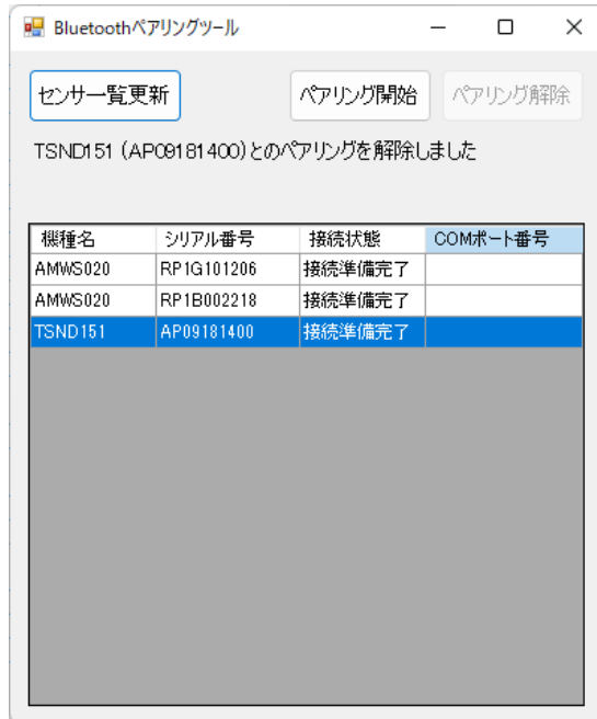
図 6 ペアリング解除後の画面

センサ情報一覧からペアリング設定の解除を行いたいセンサを選択して「ペアリング解除」ボタンを押下すると、対象のセンサとのペアリング設定を解除します。「ペアリング解除」ボタンは接続状態が「接続済み」であるセンサを選択した場合のみ押下が可能です。ペアリング設定の解除が完了すると図 6 のようにボタンの下にメッセージが表示されます。そのセンサとのペアリング設定を再度行いたい場合は対象のセンサを選択のうえ 3.3 節に従って再度ペアリング設定を行って下さい。