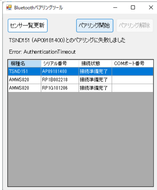
図 5 ペアリング設定失敗時の画面

センサとのペアリング設定に失敗した場合は図 5 のようにボタンの下に接続に失敗したことを示すメッセージが表示され、更にその下にエラーの内容が表示されます。この時はセンサが起動しているか等を確認のうえ、再度ペアリング設定を行って下さい。