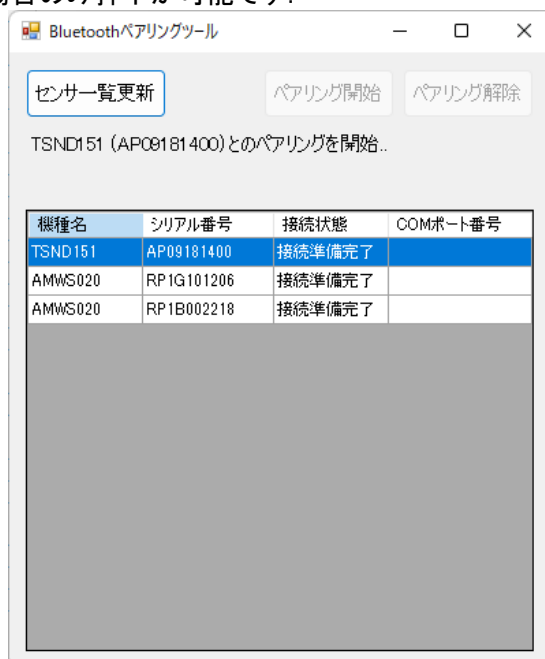
図 3 ペアリング設定中の画面

センサ情報一覧からペアリング設定を行いたいセンサを選択して「ペアリング開始」ボタンを押下すると、対象のセンサのペアリング設定を開始します(図 3)。「ペアリング開始」ボタンは接続状態が「接続準備完了」であるセンサを選択した場合のみ押下が可能です。